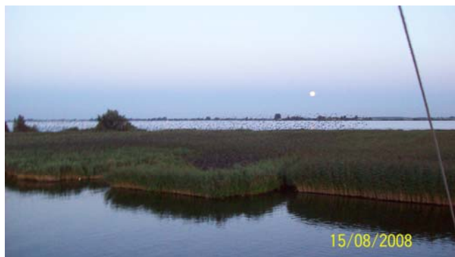
Vaartocht 2008 Rietlanden bij Leimuiden

Met de lichten aan arriveerden we in de schemering weer bij het Zorgcentrum. We danken de directie van het Zorgcentrum dat we elk jaar weer ons schip De Juliana daar mogen afmeren.