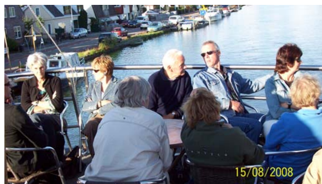
Vaartocht 2008 Op het bovendek is het goed toeven