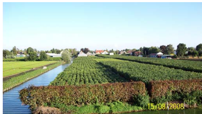
Vaartocht 2008 Cultuurakkers moeten beschermd worden