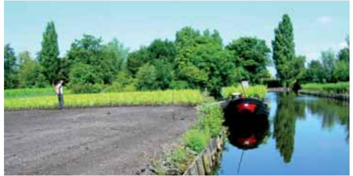
Akker bij het Koddespoeltje

De tweede aankoop betreft een akker nabij het Koddespoeltje, groot 3.470 m 2 . In deze buurt zijn al een aantal mooie seringenakkers en 2 natuurpercelen in het bezit van de Bovenlanden.