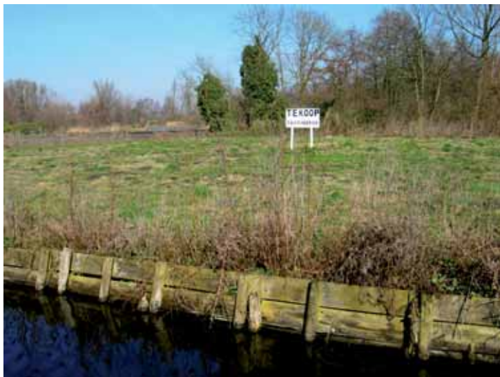
Akker in de Rijsen naast bestaand natuurgebied.

We blijven verhuur proberen. Mocht het niet lukken dan gaan we in 2010 middels een plantdag met vrijwilligers de akkers geschikt maken voor natuurontwikkeling. De akkers kunnen dan deel gaan uitmaken van een groot stuk aaneengesloten natuur met het naastgelegen bos van Staatsbosbeheer en het bos dat de Bovenlanden in 2006 heeft kunnen kopen van scheepswerf de Vries. De financiering is nog niet geheel rond. We zijn hierover al geruime tijd in gesprek met de Provincie Noord-Holland. We verwachten in maart 2010 een definitief antwoord of beslissing van de Provincie op de aanvraag te krijgen. Vanuit eigen reserve hebben we voorlopig voor kunnen financieren, met overigens veel inspanning en zorgen voor de penningmeester!