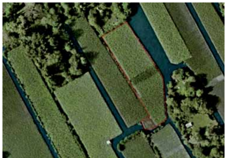
Overzichts foto van het gebied nabij het Koddespoeltje met de karakteristieke verkaveling. Rood omlijnd is het recent aangekochte perceel.

Zo langzamerhand hebben we daar een aantal clusters in bezit die tezamen kunnen worden aangemerkt als cultureel erfgoed vanwege, de voor de Aalsmeerse bovenlanden, karakteristieke verkaveling van de percelen. De aangekochte akker is al weer verpacht en bijna geheel volgepoot met jonge seringenstruiken.