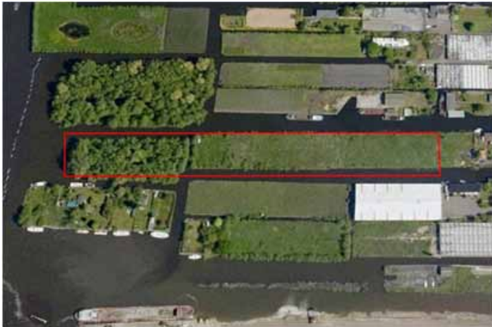
van der Schilden en omgeving

Recent is bij de notaris een perceel bos, water en akker ter grootte van 1,32 hectare overgeschreven op naam van de Stichting de Bovenlanden. Het betreft een perceel gelegen achter het voormalige Woonplaza van der Schilden in Aalsmeer Oost. Het perceel is gelegen tussen een aantal akkers die reeds in het bezit van de Bovenlanden is waaronder Jellie's Bos en van der Hoop. Dit is goed te zien op onderstaande afbeelding.