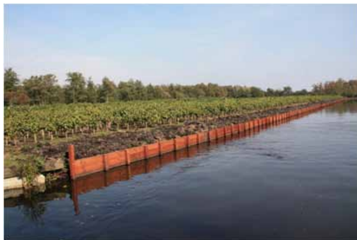
Nieuwe beschoeiing rond de Oekraïne-akker

De aanleg van 340 meter beschoeiing rond de akker Oekraïne in Aalsmeer Oost is inmiddels afgerond. De akker van 4.500 m 2 is direct na aankoop weer verpacht en zit zeer strak in de beschoeiing.