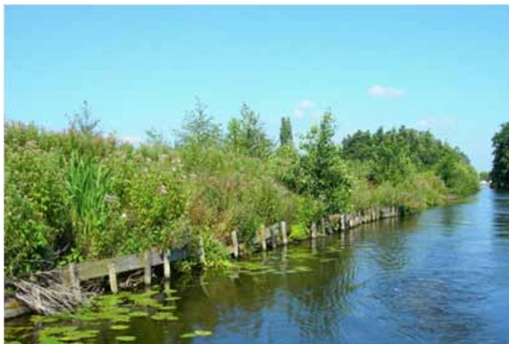
van der Schilden

De inrichting met een lage beschoeiing en aan de Ringvaartzijde een vooroever is na aanbesteding gegund aan de Rijk BV uit Leimuider die inmiddels met de uitvoering is begonnen. De Stichting Mainport en Groen financiert het geheel als één van hun laatste projecten.