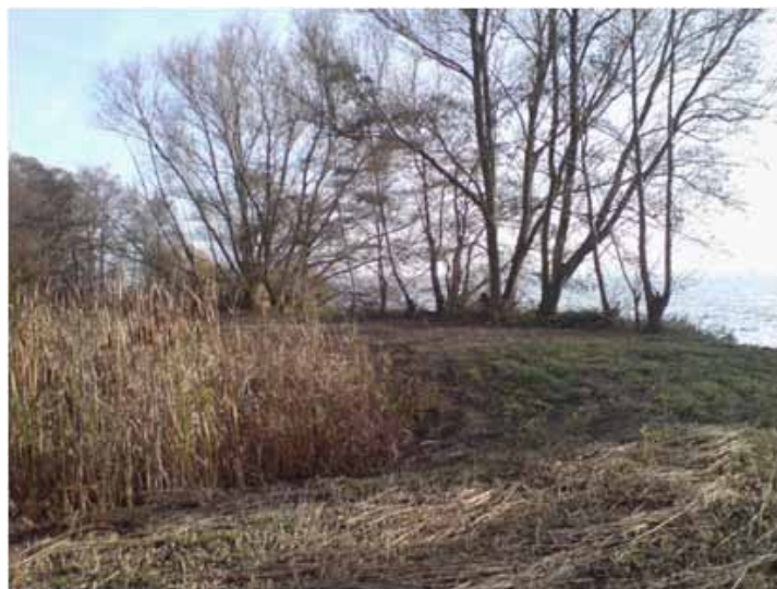
Paddepoel aangelegd op voormalige seringenakker in de Rijsen ter compensatie voor de omgelegde N201